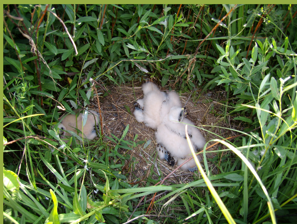
Zaštita gnijezda na poljoprivrednim površinama ključna je i direktna mjera koja omogućava preživljavanje ptića u gnijezdu.