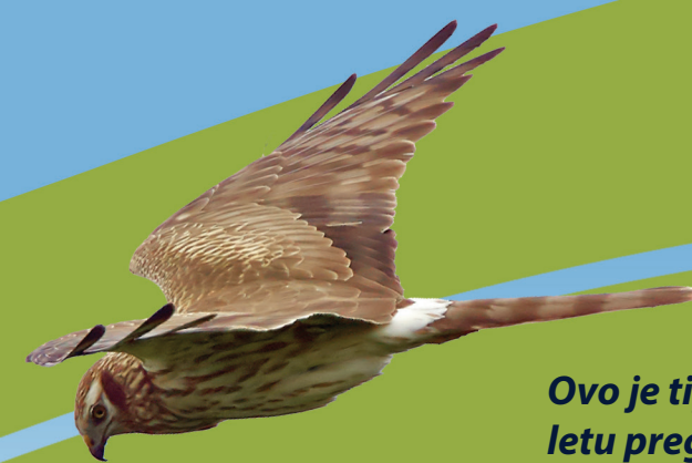
Ovo je tipična „poza“ eja dok u niskom brišućem letu pregledavaju teren u potrazi za plijenom