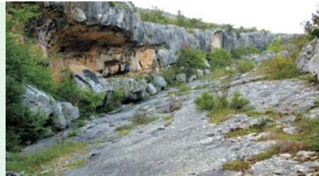
Kanjon Karišnice (The Karišnica canyon)