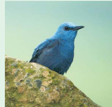
Monticola solitarius , modrokos (Blue Rock Thrush)