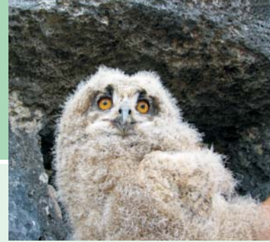
Ptić ušare (Eagle Owl nestling)