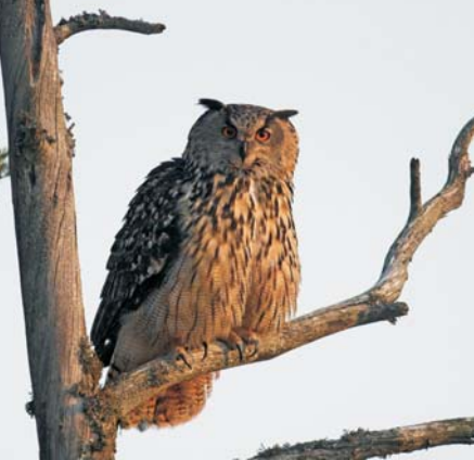
Bubo bubo , ušara (Eagle Owl)