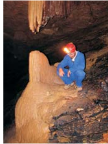
Detalj iz špilje (Detail from the cave)