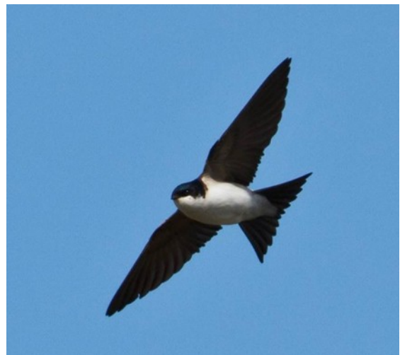
Slika 2. Piljak u letu