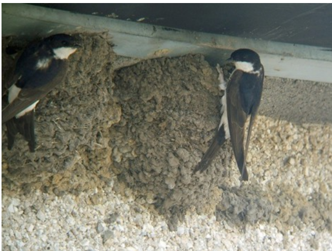
Slika 1. Piljci na gnijezdima