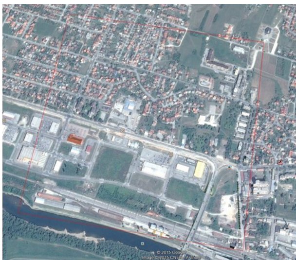
Slika 6.: Primjer odabranog 1x1 km kvadranta u Sisku (oznaka kvadranta =E4818N2508)

Prebrojavanja se mogu provoditi i na bilo kojem drugom kvadrantu 1x1 km ukoliko želite proširiti monitoring na svom području. I rezultati tih kvadranta će biti uzeti u obzir tijekom ocjene stanja populacije piljaka.